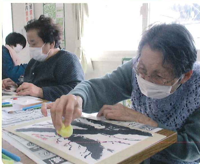
臨床美術@金山仮設団地

国際NGO特定非営利活動法人オペレーション・ブレッシング・ジャパン(OBJ)です。一昨年12月から仮設団地のコミュニティ支援を継続中です。