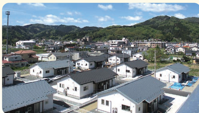
▲集会所からは町中心部が一望できる

木造平屋と5階建て集合住宅あわせて90戸が整備される神明住宅では、現在、入居(予定)者の中から選出された世話役の方々を中心に、今後の地域活動についての話し合いが進められています。住宅会の設立まであと一歩、新たなコミュニティの誕生が待ち遠しいです。