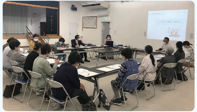
▲丸森地区での打合せの様子

令和5年度移動教室&こども食堂スタートに向けて、主任児童委員の皆さんをはじめ、こども食堂に協力してくださっている丸森地区婦人会や金山地区更生保護女性会などの関係者およそ30人が参加し、「被災経験によるこどもの心のケガが及ぼす中長期的な影響」と「心のケガの回復には、気遣ってくれる複数の信頼できる大人の存在が大切な役割を果たす」ことについての理解を深め、地域で子どもたちを守り育てる気持ちをあらたにしました。