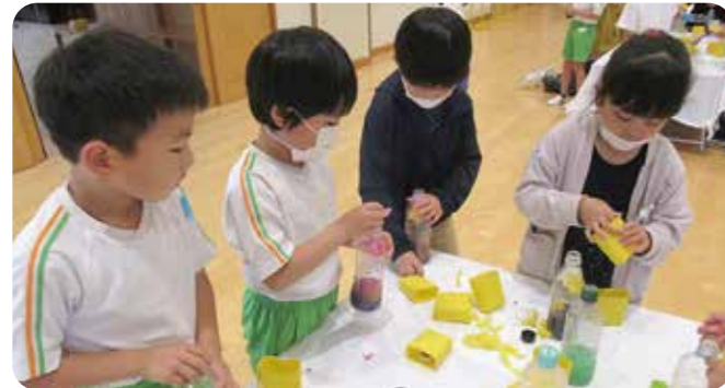
▲想像した色に近づけるために、自分で考えて、おはながみを何枚も足す姿がありました

年長児と1年生は色水遊びをしました。おはながみを選び、ちぎって水と混ぜて振ることでオリジナルの色を完成させました。年中児と2年生は創作遊びをしました。フラワーアレンジメントでは、様々な雑草や花を使ってアレンジを楽しんだ子どもたちです。