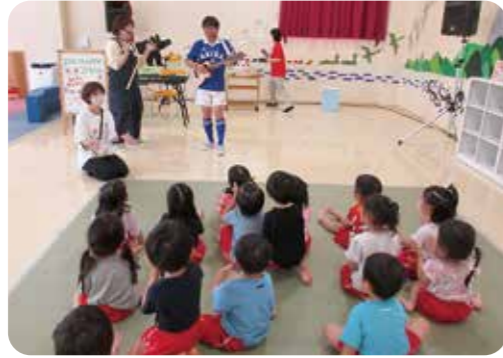
▲あきらちゃん＆あんこちゃんの「えんそくあそびうたコンサート」を見学しました

3歳・4歳・5歳の園児がバスに乗って園外保育に行きました。3歳児は白石市の「こじゅうろうキッズランド」へ行き、迫力満点の大型遊具で身体を使って元気いっぱい遊びました。4・5歳児は「八木山動物公園」へ行き、様々な動物を見て、餌は何を食べるか、どんなところに住んでいるのか等、興味を持ったようです。昼食は保護者の手作りのお弁当でした。嬉しそうなおもたちの表情が可愛らしかったです。