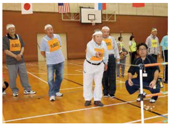
スポーツ大会の様子

身体障害者の手帳をお持ちの方が会員となって、地域の障害者の皆さんとの交流を深めたり、研修会やスポーツ大会に参加するなどの活動をしています。写真はスポーツ大会の様子です。 ちなみに、身体障害者手帳をお持ちの方であれば、どなたでも入会可能です。年会費は1,000円となっています。