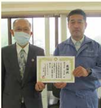
株式会社石川組さま

仙南地域福祉サポートセンター ☎ 0224-86-3811 丸森町社会福祉協議会 ☎ 0224-72-2241