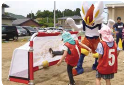
▲エースバーンもチームに入って試合開始です！「ゴールに向かってシュート！」

5月25日（金）に2歳児から5歳児を対象にしたサッカー教室を行いました。この日は、宮城県サッカー協会のコーチとサプライズで日本サッカー協会からポケモンのエースバーンが来所し、ボール遊びをしたり、サッカーの試合をしたりして楽しみました。子どもたちは、夢中になってボールを追いかけて、体をいっぱい動かしながら気持ちのいい汗をかいていました。