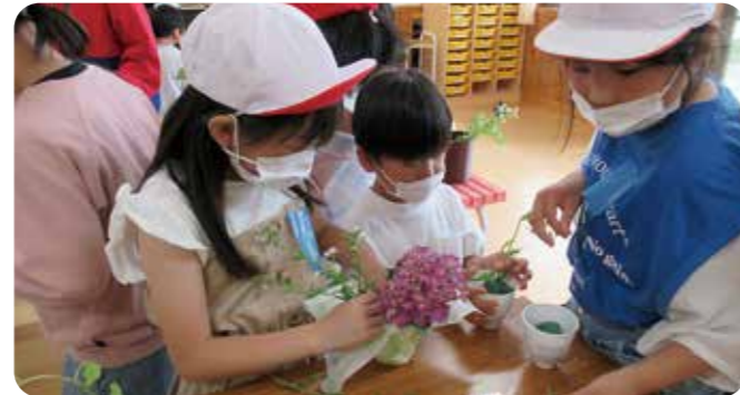
▲選んだあじさいで花束を作り、完成した作品を持ち帰りました