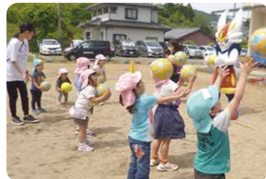
▲ボールをポーン！両手でキャッチ！「できた～♪」と嬉しそうでした