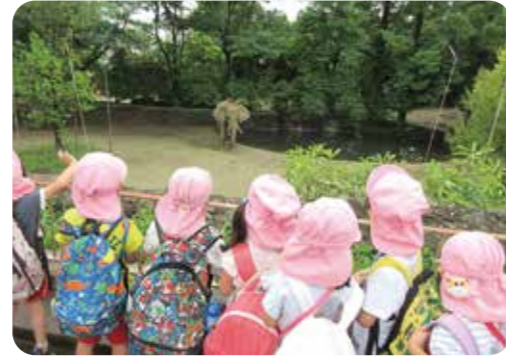
▲大きなゾウを目の前で見学することができ、夢中で見ていました