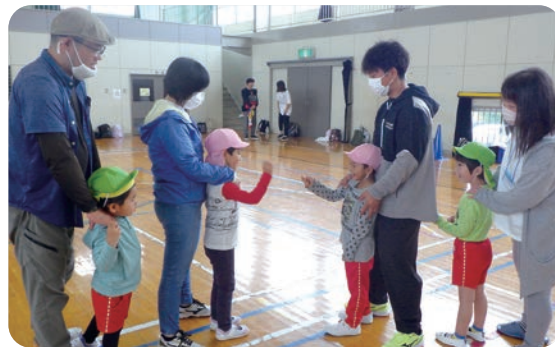
▲「じゃんけんぽん！」負けたら勝った人の後ろにつながります。どこまで長い列車になるかな？