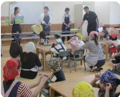
▲初めての味噌作り♪貴重な経験がすることができました!!

柔らかく茹でた大豆を一粒だけ食べ、豆そのものの甘さを味わいました。親子で粒が無くなるくらい大豆を潰し、米麴と塩を混ぜ合わせました。どんな味や色の味噌が出来上がるか今から楽しみです。