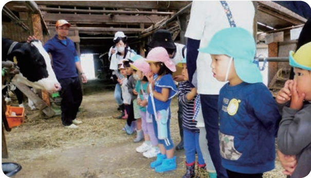
▲牛さんを前にお話しを聞きました

2～5歳児が、黒佐野地区にある八巻ファームさんの牛を見学に行きました。間近で牛を見て「牛さんおっかい」「まつ毛が長い」「爪の先がわかれていいる」などと話していた子どもたちです。とても貴重な体験ができました。