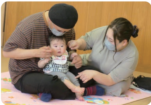
▲わらべうたのリズムが心地いいね

丸森たんぽぽこども園では、「えがお」と「ありがとう」を大切に、一人ひとりの気持ちを受け止め、寄り添いながら保育をしています。ふれあうことでぬくもりや愛情を伝えることのできる愛着形成が乳幼児期の心の発達には大切とされている為、0歳児から2歳児クラスは、親子でわらべうた遊びをしたり、3歳児から5歳児クラスは、各年齢に合わせて親子で体を動かして遊ぶ行事を実施しました。