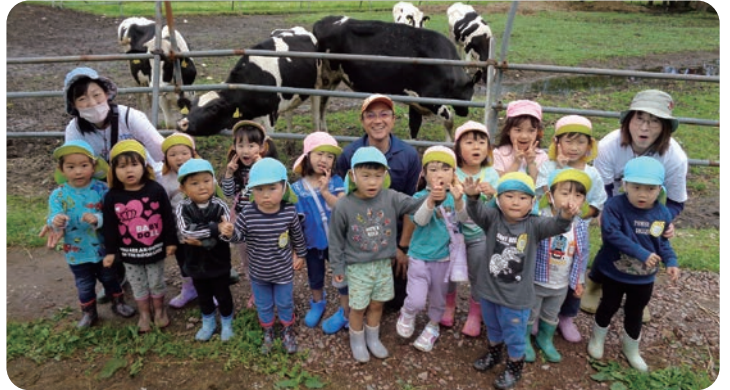
▲集まってきた牛さんと一緒に「はい、チーズ」