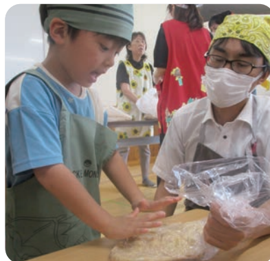
▲手の平を使って、大豆を潰しました