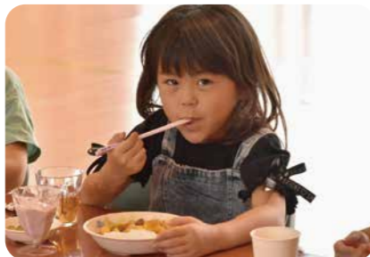
▲「包丁で切るときは硬かったにんじんやじゃがいもが柔らかくなっている！」