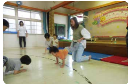
▲手押し車は、手で体を支える力、良い姿勢を保つ、体幹を鍛えることができる！