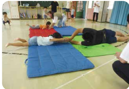
▲まっすぐ走れるようになるには、えんぴつ回りがよい！