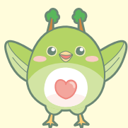
丸森町社会福祉協議会 マスコットキャラクター うぐたん