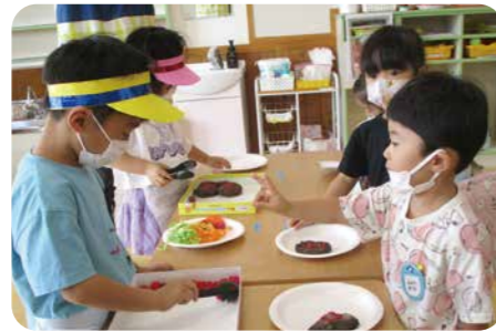
▲「2個ください」「はいどうぞ！」