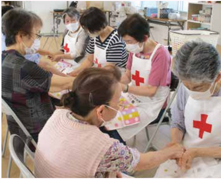
▲サロンでのハンドマッサージの様子