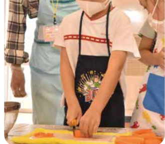
▲猫の手にしてにんじん切ってみよう！

5歳児の子どもたちが地域の方々と一緒にカレークッキングに挑戦！ピーラーや包丁の使い方を教えていただきながら、安全にクッキングの体験ができました。出来上がったカレーを地域の方と一緒に食べていると、「みんなで作ったからおいしいね」「苦手な野菜も食べられたよ！」等の声が聞こえ、何度もおかわりをしてお腹一杯の子どもたちでした。