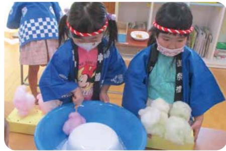
▲わたあめをつくる姿はまるで本物の店員さんのよう！

3歳児はアイス屋さんとお弁当屋さん、4歳児はハンバーグ屋さん、5歳児はりんごあめ屋さんとわたあめ屋さんのおみせを開きました。子どもたちは、「いらっしやいませー」「何味にしますか？」と店員さんになりきってお客さんとやりとりをし、ハンバーグやスパゲッティをお皿に並べたり、交代でお客さんになって袋いっぱい買い物をして、みんな大満足でした。