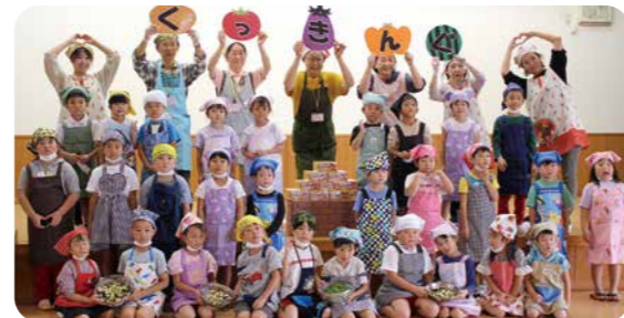
▲いろいろな食材をたくさん食べて、元気いっぱい遊ぼう！