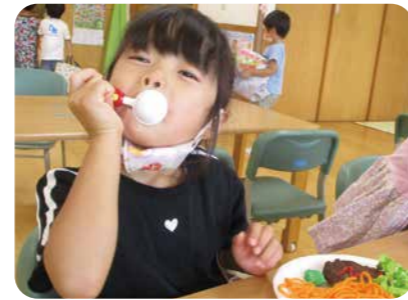
▲イートインコーナーでパクリ♡