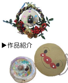
▲自然物でモノづくり！