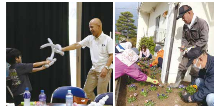
△パルーンアート講座

私が初めてのボランティアに参加したのは、60歳の時に台風19号での災害ボランティアでした。もともと引っ込み思案なところがあって、ボランティアに興味はあったけど参加できずにいました。ただ、東日本大震災の時にボランティアに参加できなかったのがずっと心残りでした。そんな中、丸森町が被災し自宅も生活はできるけど被害を受けました。地元で起きた大きな災害、何か自分にできることはないかと考えているうちに自然と災害ボランティアセンターに足が向いていました。ボランティアとして活動していく中で、一緒にグループになった方が、住民の方に「ボランティアさせてくれてありがとうございます。」と言っているのを聞いて、ボランティアって一方的な支援でなくお互い様の精神なんだと感じました。ボランティアを続けるうちに顔見知りも増え、たくさんの繋がりができました。ボランティアって意外とハードルは高くないと思います。知らない世界に飛び込むのは勇気がいります。でも60歳の自分でも初めての一步を踏み出せたんですから、皆さんも自分のできる範囲で小さな一步でも踏み出してみると新しい自分が発見できるかもしれませんよ。