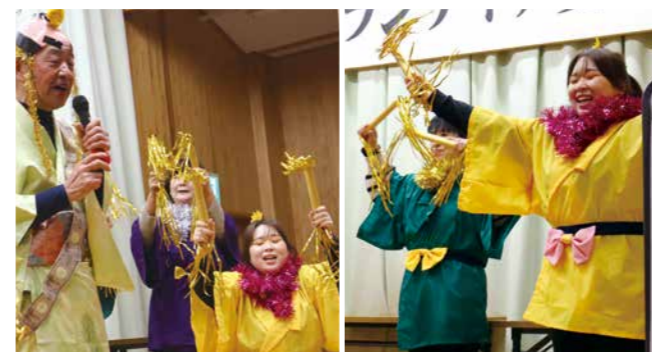
△ボランティア交流会でマツケンサンバを披露

私は今、大張カラオケ愛好会のメンバーとして活動をしています。昨年に発足したばかりのグループですが、住民さんの前で発表するなど楽しく活動をしています。私自身、カラオケ愛好会に入る前までは、ボランティアをした経験が無く、ボランティアと聞くと青年海外協力隊などのイメージで自分には遠いものだと思っていました。ただ、子どもの頃を振り返ると地域のお祭りなど、みんなで力を合わせて準備しているのを近くで見ましたが、あれも地域の繋がりから生まれるボランティア活動だったんだと思います。大学の時に関東に行きましたが、結婚を機に丸森町に戻ってきて、困ったら地域の人で支え合う繋がりや強さを改めて感じています。昔から顔見知りの大張の皆さんと一緒にカラオケ愛好会として活動をする中で、お客さんの笑顔や生き生きと活動するメンバーの姿、皆さんから元気をもらって自分も楽しく頑張っています。人生一度なので、興味や迷う気持ちがあれば、皆さんもまずはやってみたらいいんじゃないかなと思います。