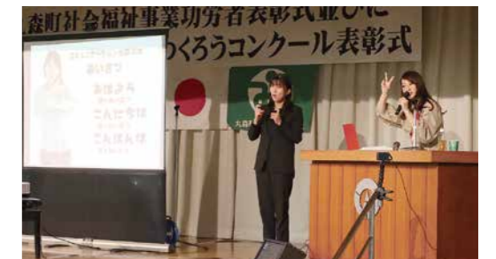
▲障害を理解するための講演会の開催(手話講演会)