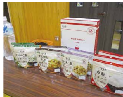
▲防災食、用品の備蓄、展示