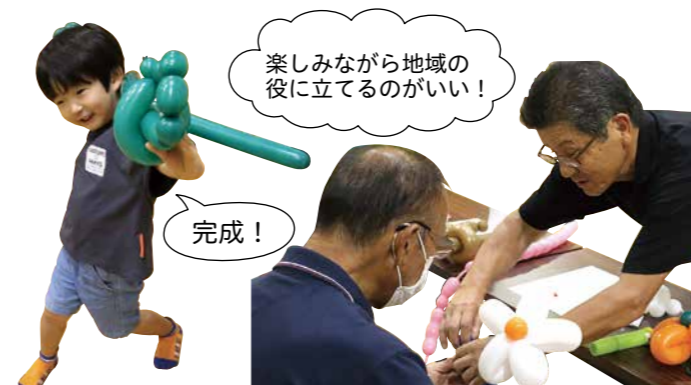
▲趣味から始めるボランティア講座(バルーンアート)

ふれあいサロンや子ども食堂など、地域の様々な活動についての情報収集・情報発信をするとともに、地域に新たな活動が増えるよう、活動の立ち上げに向けた相談、コーディネートを行いました。