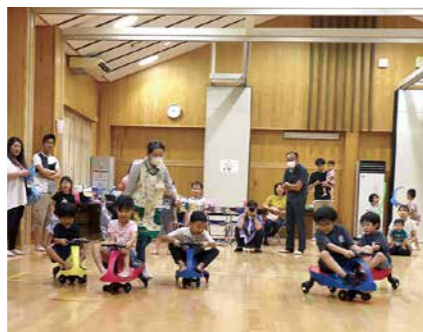
▲子どもの遊び場事業