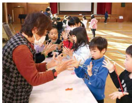
▲世代間交流事業(もりもりクラブ)