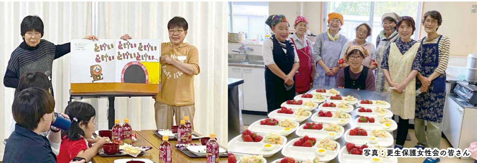
写真：更生保護女性会の皆さん