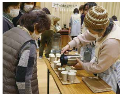
▲ボランティア養成・派遣(コーヒーの淹れ方)