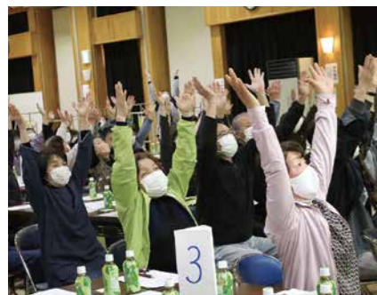
▲町内のサロン支援