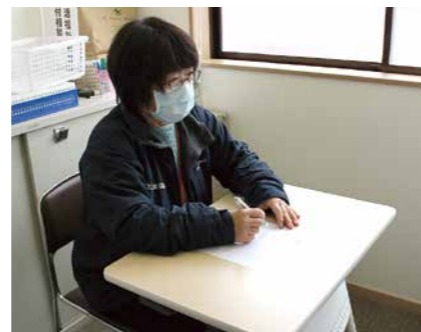
▲生活の困りごとに関する相談支援